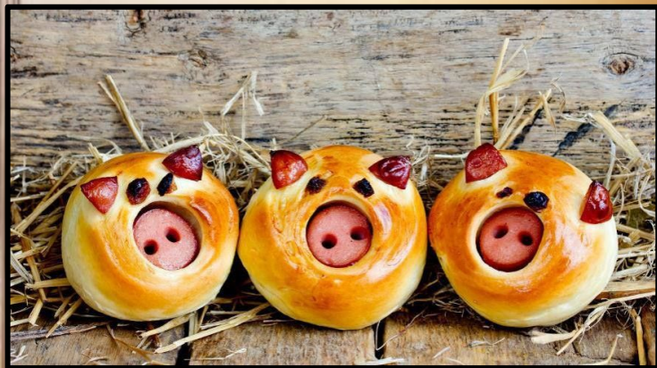
American pigs in a blanket